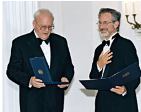
Bundespräsident Roman Herzog überreicht dem amerikanischen Filmregisseur Steven Spielberg für den Film „Schindlers Liste“ das Große Verdienstkreuz mit Stern des Verdienstordens der Bundesrepublik Deutschland am 10. September 1998

Bei Verleihungen im Ausland wird die Aushändigung des Verdienstordens zumeist von den deutschen Botschaftern, die die Vertreter des Bundespräsidenten im jeweiligen Staat sind, vorgenommen.