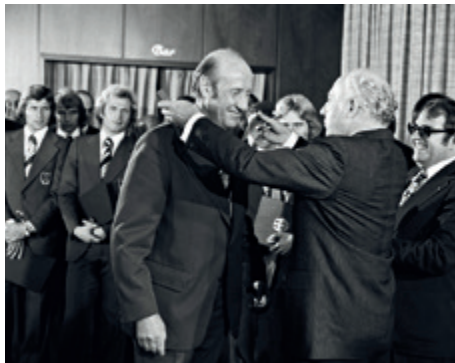
Bundespräsident Walter Scheel überreicht Helmut Schön, Bundestrainer der Fußballnationalmannschaft, anlässlich des Gewinns der Weltmeisterschaft das Große Verdienstkreuz des Verdienstordens der Bundesrepublik Deutschland am 23. September 1974

Der Bundespräsident verleiht den Verdienstorden, händigt ihn aber nur selten persönlich aus. Die Aushändigung delegiert der Bundespräsident unter anderem an die Ministerpräsidenten der Länder, Bundes- oder Landesminister, Regierungspräsidenten, Landräte oder Bürgermeister.