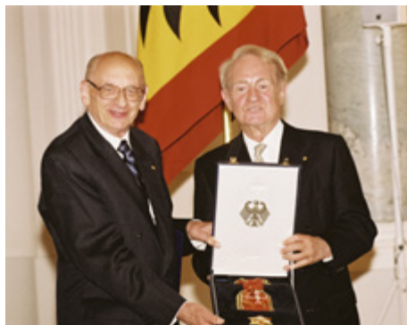
Bundespräsident Johannes Rau verleiht dem polnischen Außenminister Władysław Bartoszewski am 3. September 2001 das Großkreuz des Verdienstordens für seine Verdienste um die Versöhnung von Deutschen, Polen und Juden