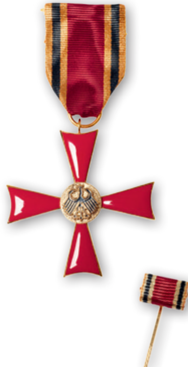
Verdienstkreuz am Bande