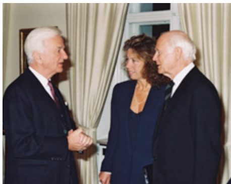
Bundespräsident Richard von Weizsäcker empfängt Evelyn Hamann und Vicco von Bülow (Loriot) am 30. November 1993 zu einer Ordensverleihung in Schloss Bellevue

Wer seine eigene Auszeichnung anregt, kann nach dem Ordensrecht nicht mit einer Verleihung des Verdienstordens rechnen. Auch kann der Verdienstorden in der Regel nicht posthum verliehen werden.