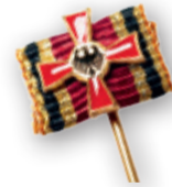
Verdienstkreuz 1. Klasse