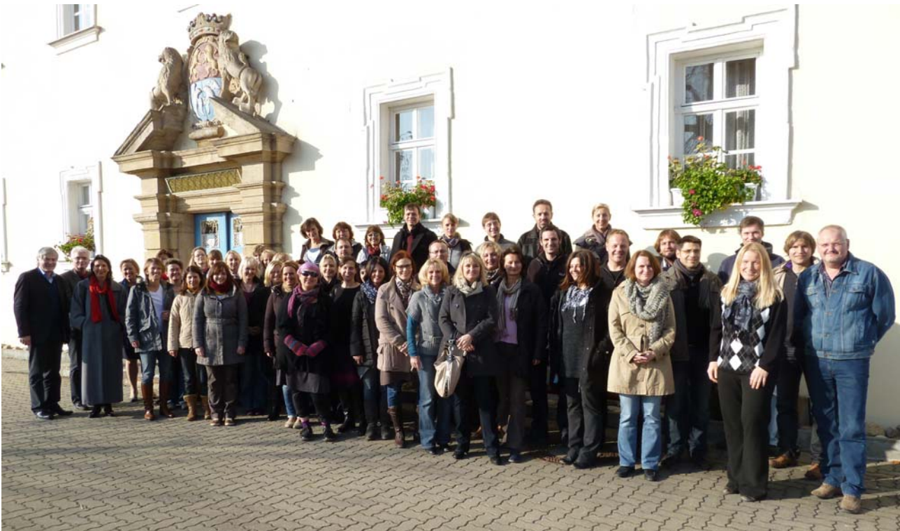
Die oberfränkischen Kurse vor der Tagungsstätte Schloss Schney

Die Inhalte des Lehrgangs wurden in acht Bausteine gegliedert und von Referenten aus der Schulaufsicht, der Lehrerbildung und der Schulleitung den Teilnehmern näher gebracht: