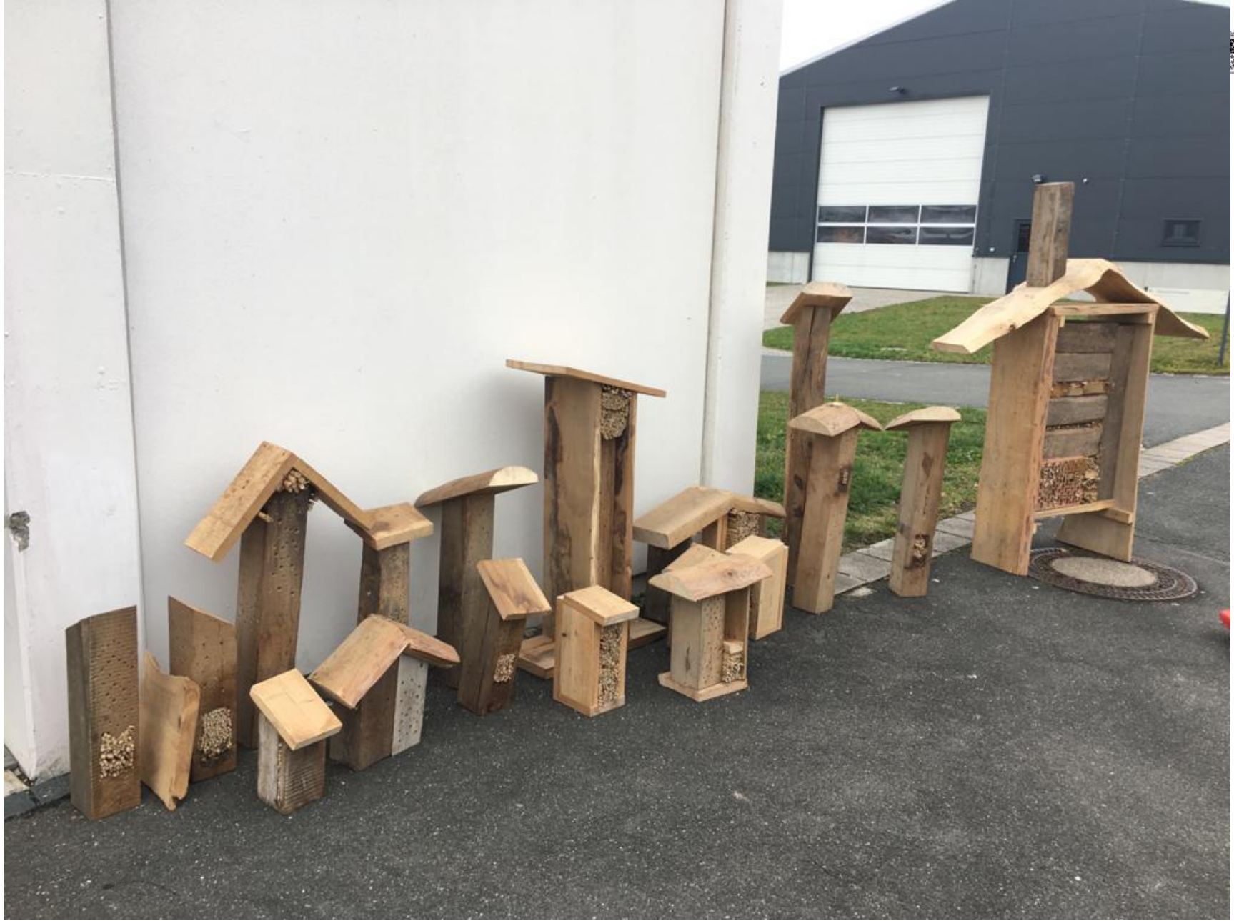
Nisthilfen für Wildbienen