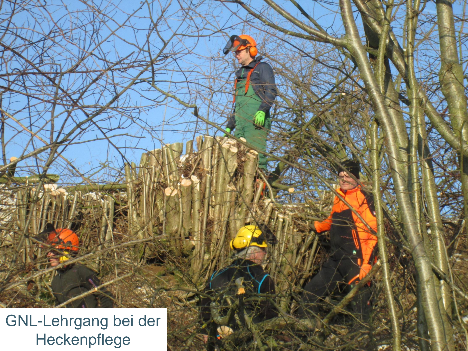
GNL-Lehrgang bei der Heckenpflege