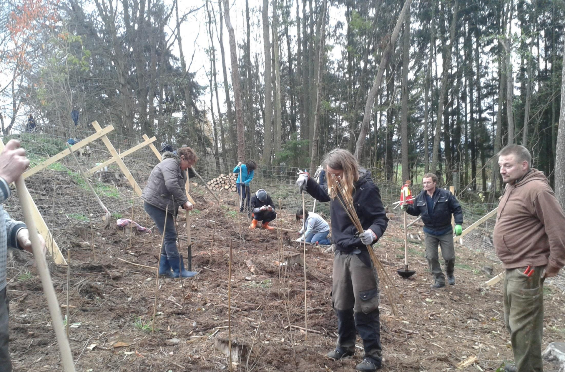
Erhalt und Gestaltung unserer Kulturlandschaft – GNL-Lehrgang bei der Pflanzung einer Hecke