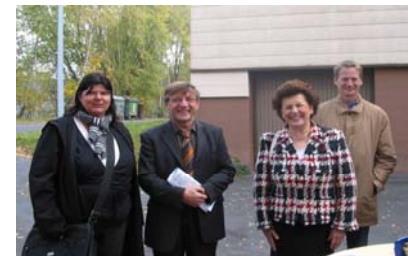
Verantwortliche in Marktredwitz

Information zum oberfränkischen Beitrag "Am Sterngrund" in Marktredwitz