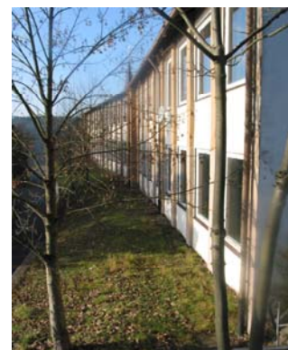
Schule in Wilhelmsthal