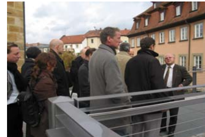
Besichtigung "Obere Mühlen"

Teilnahme und Mitwirken bei Ortsbesichtigung der Kleinwasserkraftanlagen Obere Mühlen