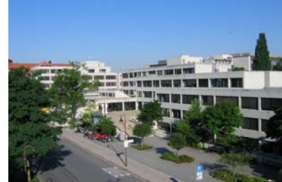
Technisches Ämtergebäude Bayreuth