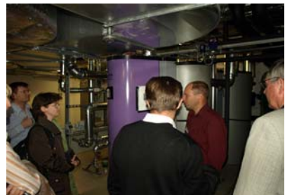
Führung im Technikkeller