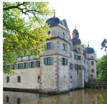
Tagungsstätte Schloss Mitwitz