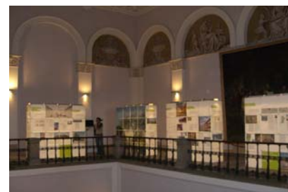
Ausstellung im Maximilianeum