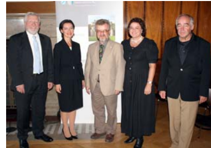
Verantwortliche der Bayerischen Ingenieurekammer und ROfr

18 Energietag Bayreuth der Bayerischen Ingenieurekammer-Bau im Landratsaal der Regierung Koordination, Teilnahme und Pressebericht