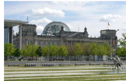
Am Reichstag in Berlin