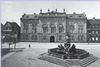
Präsidualbau um 1910