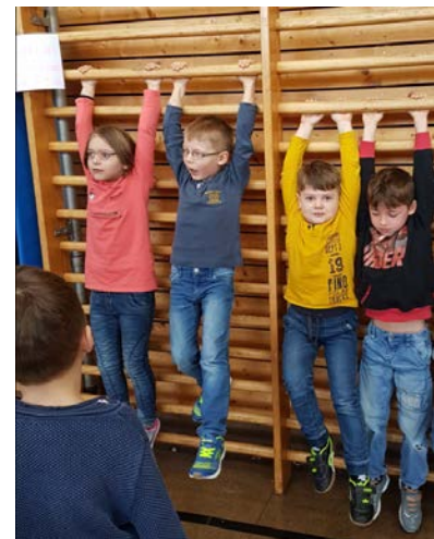
Wie lange schaffe ich das?