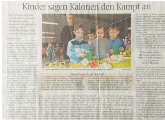
Bericht über ADI&ADINE, Frankenpost, 07.03.2018

wertvolle Tipps für eine gesunde Lebensführung bekommen und in dem eigene richtige Ernährungsgewohnheiten oder sportliche Aktivitäten dokumentiert werden sollen. In diesem Heft ist auch Platz für Belohnungsticker mit den Identifikationsfiguren ADI&ADINE, die zum Beispiel für ein gesundes Pausenbrot, eine Radtour, eine längere Lauf- oder Schwimmstrecke oder ähnliche, in Hinsicht auf Gesundheit positive Verhaltensweisen, vergeben werden. Dazu gibt es eine Brotzeitbox, ebenfalls mit Bildern der Superhelden ADI&ADINE und einen elektronischen Schrittzähler für das Handgelenk.