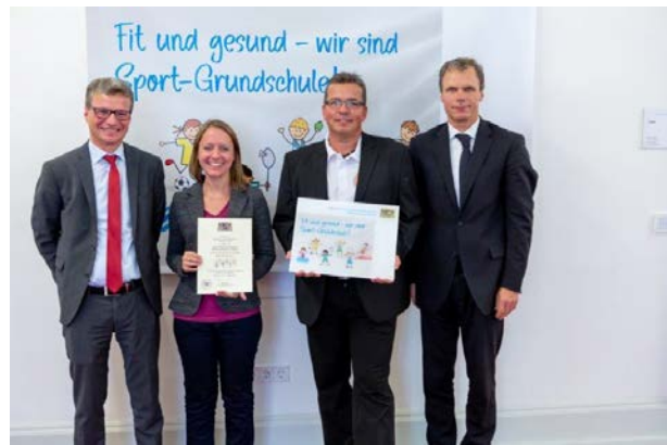
Jean-Paul-Grundschule Schwarzenbach a.d.Saale