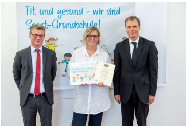
Grundschule Bayreuth-St. Georgen