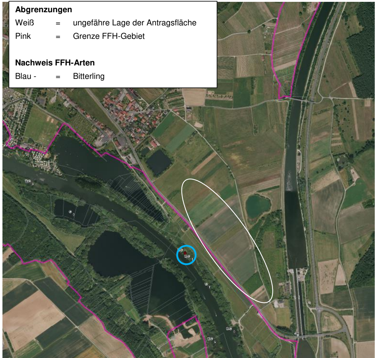
Abbildung 5: Im Rahmen der Managementplanerstellung erfasste Anhang II-Arten im FFH-Gebiet

Die Abbildung 5 zeigt die im Umfeld um das Vorhaben im Rahmen des FFH-Managementplans (IVL 2022, Entwurf zur Verfügung gestellt durch die Regierung Unterfranken) erfassten Lebensstätten der Arten des Anhang II.