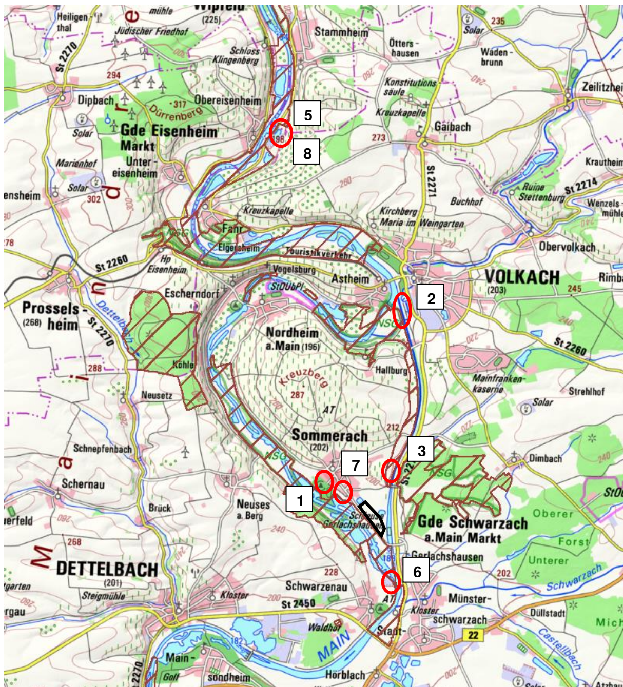
Abbildung 6: Lage der relevanten Planungen und Projekte im FFH-Gebiet

(rot = Projekte, schwarz = Antragsfläche Planfeststellung, Schraffur = FFH-Gebiete)