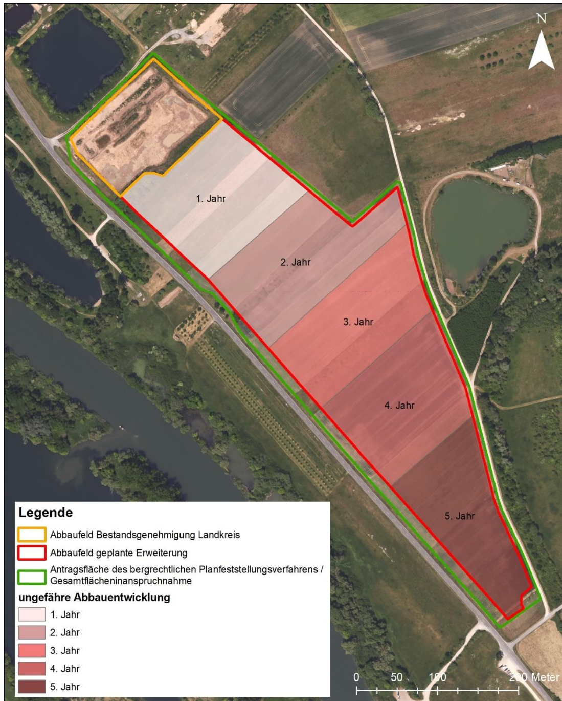
Abbildung 3: Abbauentwicklung in den Abbaufeldern der genehmigten sowie der geplanten Erweiterung (aktualisierte Abbildung, Stand 15.11.2024).

Die Antragsfläche für den Rahmenbetriebsplan Quarz-Kiessandtagebau Sommerach / Main beansprucht 11,84 ha (RBP, HGN, 12/2024). Der Abbau soll ab Planfeststellung als Nassbaggerung innerhalb von 6 Jahren und in 6 Teilabschnitten erfolgen (Abbildung 3). Es wird von einer mittleren Stärke der verwertbaren Kies- und Sandschicht von ca. 11 m und einer abbaubaren Materialmenge von ~1,1 Mio. m 3 bzw. ~1,6 Mio. t ausgegangen (RBP, HGN, 12/2024). Der Abbau erfolgt fortschreitend, so dass jeweils im Winter für das Folgejahr die nächste Abbauschleife von Mutterboden beräumt werden soll. In den sechs Betriebsjahren werden jedes Jahr rund 2 ha Mutterboden abgeschoben.