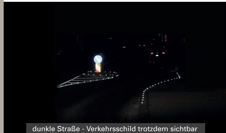
dunkle Straße - Verkehrsschild trotzdem sichtbar

Nach §17 und §32 der Straßenverkehrsordnung sowie Art. 51 des Bayerischen Straßen- und Wegegesetzes besteht eine konkrete Beleuchtungsverpflichtung für Gemeinden aus Gründen der Verkehrssicherung nur dort, wo dies dringend erforderlich ist und trotz Fahrzeuglicht und angemessener Geschwindigkeit eine besondere Gefahrenstelle beispielsweise aufgrund von Verkehrshindernissen vorliegt. Eine Dimmung, sowie Teil- bzw. Vollabschaltung der Beleuchtung stellen daher rechtssichere Methoden zur Einhaltung bestehender Gesetze dar. Bis heute existieren keine bindenden Vorgaben für Beleuchtungsstärken. Richtwerte wie jene der Industrienorm DIN EN 13201 sind unverbindlich und führen zu Überbeleuchtung.